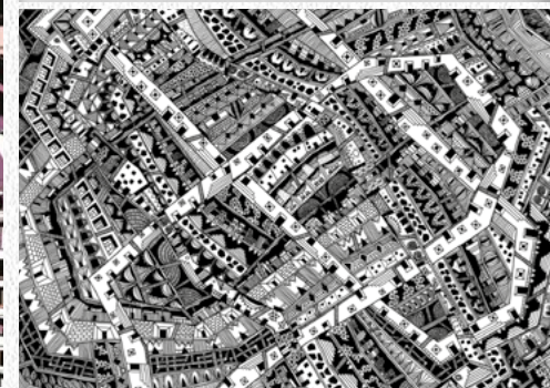
[IN]VISIBLE CITIES PROJECT - ZOBÉIDE - Karina Puente