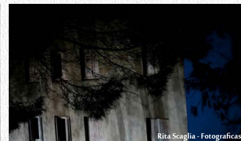
Rita Scaglia - Fotograficasa