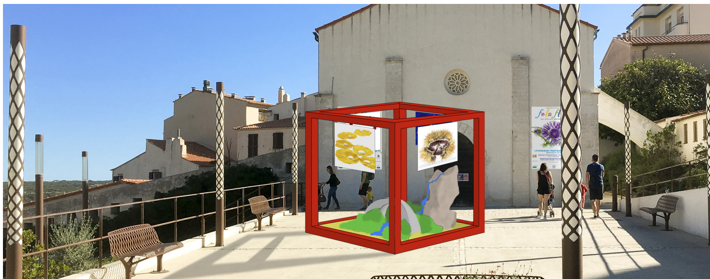
Œuvre monumentale à l'arrivée du parcours, l'Arche sera immortalisée par les touristes et circulera sur les réseaux sociaux.

Arche est une installation monumentale de forme cubique. Elle marque l'aboutissement du pavage qui guide le visiteur jusqu'au parvis de l'Espace culturel Saint Jacques, depuis le port vers la ville haute. Elle fait le lien avec l'exposition des tirages originaux dans ce même espace. L'artiste propose de détourner une pergola bio-climatique Austral®. Partie intégrante de l'œuvre, cette pergola abrite au sol une installation minérale et végétale en résonance avec les images disposées dans sa partie supérieure.