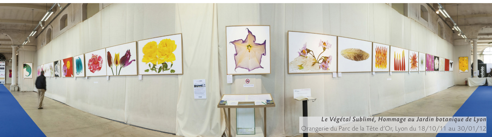
Le Végétal Sublimé, Hommage au Jardin botanique de Lyon Orangerie du Parc de la Tête d'Or, Lyon du 18/10/11 au 30/01/12

Le point de départ et Le point commun de toute civilisation.