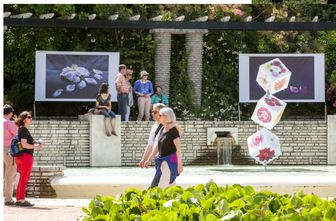
La Rose et Le Vent Roseraie du Parc de la Tête d'or, Lyon du 28/05 au 30/10/2015

FOLAFLORA.COM LEVEGETALSUBLIME.COM SUBLIMATIO.COM/FINEART